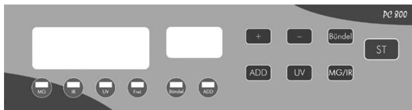
Image: PC 800 E