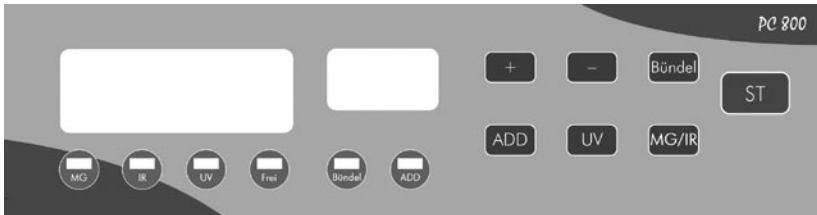
Image: PC 800 E