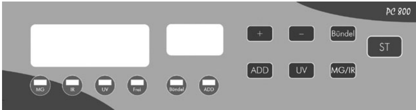
Abbildung PC 800 E